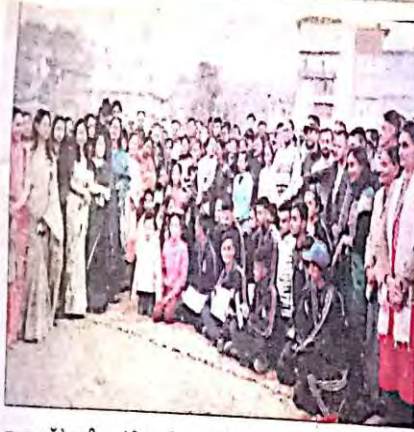
नाहन कॉलेज की एथलेटिक्स मीट स्पर्धा के विजेता खिलाड़ी कॉलेज स्टाफ के साथ। स्वाद