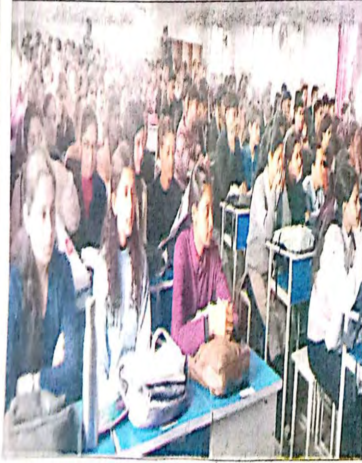
नाहन : कालेज में आयोजित कार्यक्रम में मौजूद विद्यार्थी।