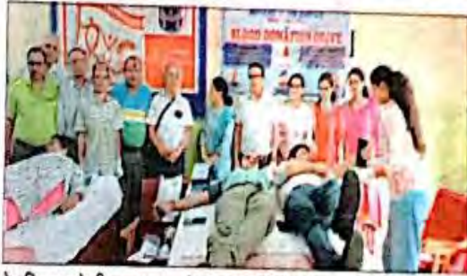
रेड रिबन व रोटरी क्लब नाहन के रक्तदान शिविर में रक्तदान करते लोग।

नाहन (सिरमौर)। राजकीय स्नातकोत्तर महाविद्यालय नाहन में अंतरराष्ट्रीय युवा दिवस के उपलक्ष्य में महाविद्यालय रेड रिबन क्लब और रोटरी क्लब नाहन के संयुक्त तत्वावधान में आईएचबीटी विभाग नाहन मेडिकल कॉलेज के सहयोग से रक्तदान शिविर का आयोजन किया गया।